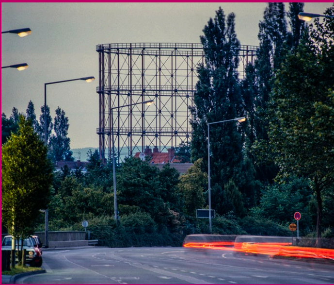
Kalle Noltenhans : Paderwall · Fotografie · 1980er Jahre Stadt- und Kreisarchiv Paderborn