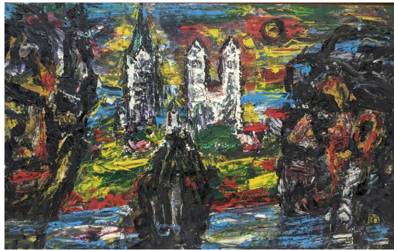
Josefthomas Brinkschröder (1909–1992) Stadtansicht mit Köpfen Öl auf Holz · 1980er Jahre

Zu sehen sind impressionistische Werke eines Willy Lucas (1884–1917) oder Josef Struck (1889–1963), eine Stadtansicht von Josef Dominicus (1885–1973) sowie expressionistisch-surrealistisch anmutende Bilder von Josefthomas Brinkschröder (1909–1992), Zeichnungen der Paderborner Künstlerin Edith Wulf (*1935) und vielen anderen. Es sind Gemälde und Zeichnungen, die die Architektur und Details von Paderborn offenbaren und in denen Plätze und Gebäude aus vergangenen Zeiten wieder zum Leben erweckt werden.