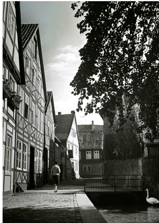
Rudolf Lindemann- Schwan und Passant, auf den Dielen um 1938

Die Ausstellung zeigt zudem erstmalig Fotografien von Rudolf Lindemann (1904–2004) aus dem Bestand des Stadt- und Kreisarchivs. Der 1904 in Borgentreich geborene Lindemann erlernte an der Staatslehranstalt für Lichtbildwesen in München das Fotografierenhandwerk und schloss seine Ausbildung Anfang der 1930er-Jahre mit Diplom und Auszeichnung ab. 1934 gründete er in Münster ein eigenes Fotoatelier. Nach dem Krieg eröffnete er 1946 neben seinem Atelier in Einbeck ein Fotofachgeschäft.