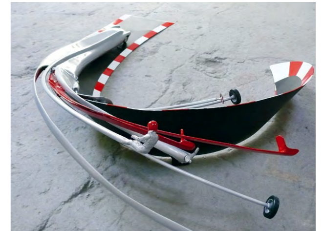
Stefan Rohrer, Speedster, 2007, Modellauto, Stahl, Lack

The works of the Stuttgart sculptor Stefan Rohrer (*1968) enter into a bold dialog with Fratt's works. He forms his sculptures from old motor scooters and automobile bodies, which he accentuates with color. In this creative process, the scooter and car bodies are dismantled, stretched, looped, reassembled, painted in pop colors using automotive paint, and polished to a high gloss, thus, he creates sculptures that mutate from the familiar to the fantastic. With finesse, he shapes his material into dynamic structures that appear to accelerate, and to veer off course, as it were.