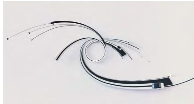
Stefan Rohrer, Commodore, 2013, Modellautos, Stahl, Lack

In einen kecken Dialog dazu treten die Werke des Stuttgarter Bildhauers Stefan Rohrer (*1968), der aus alten Motorrollern und Modellautos seine Skulpturen formt und mit Farbe akzentuiert. Karosserien werden zerlegt, gedehnt, geschlungen und neu zusammengesetzt. So baut er in Popfarben lackierte, auf Hochglanz polierte Skulpturen, die mit bekannten Formen beginnen und alsbald ins Fantastische mutieren. Mit Finesse verformt er sein Material zu dynamischen Gebilden, die mal elegant geschwungen, mal in wilden Loopings in den Raum ausgreifen, gleichsam abheben und aus der Bahn geraten.