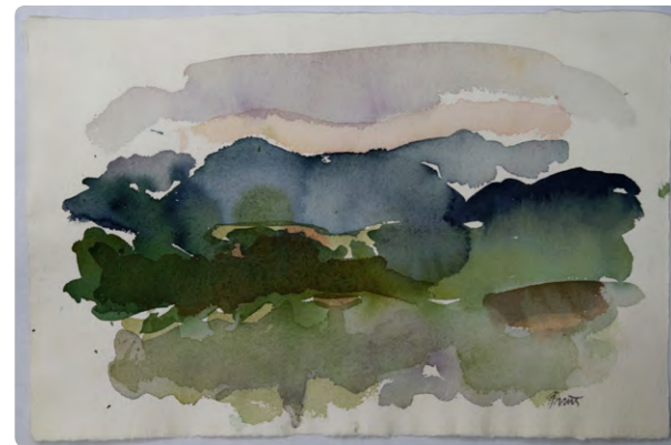
Dorothy Fratt, Landscape, 1972, Aquarell

Ihre Gemälde wie auch ihre graphischen Arbeiten sind von einem gewissen Chic, keinesfalls temperamentlos, aber nicht aufsässig oder aggressiv. Dorothy Fratts Kunst ist nicht die Negierung von Form, sondern die Formung von Farbe. Dass sie sich so vertrauten Schablonen des Abstrakten Expressionismus und des Color Field Painting entzieht, macht sie zur eigenständigen Künstlerfigur in der Mitte des zwanzigsten Jahrhunderts.