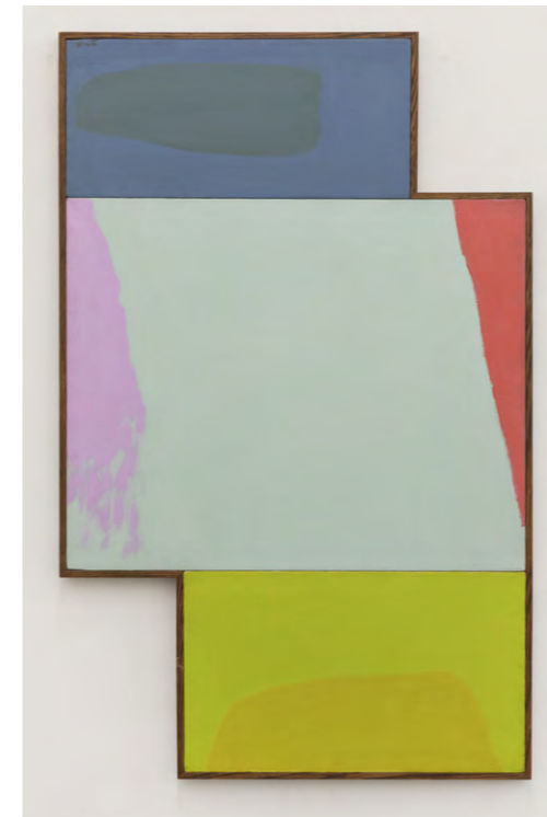
Dorothy Fratt, August, 1972, Acryl auf Leinwand

The American artist Dorothy Fratt (1923-2017) is a real discovery. From the 1950s, far from the major metropolitan art centers, she developed a very personal pictorial language juxtaposing and interweaving color spaces in a two-dimensional painting style. Playing with both strong contrasts and fine color nuances in a less gestural manner than some of her contemporaries, she investigated the interplay of colors and their effect on the surface material. Both her paintings and her graphic works have a certain elegance, and they are by no means without temperament, nor are they rebellious or aggressive. Dorothy Fratt's art is not the negation of form, but the shaping of color. That she eluded such familiar categorization as Abstract Expressionism and Color Field Painting made her an independent artist figure of the mid-twentieth century.