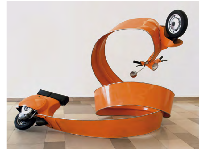
Stefan Rohrer, Arancio, 2011, Roller, Stahl, Lack