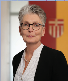
Claudia Warnecke © Claudia Warnecke

Themenschwerpunkte waren in den vergangenen Jahren die Revitalisierung des Domplatzes und der Königsplätze, das Themenfeld Mobilität einschließlich ÖPNV, die Entwicklung der ehemaligen Kasernenstandorte Alanbrooke und Zukunftsquartier und das Entwicklungskonzept Flusslandschaft Pader mit der Bewerbung um das Europäische Kulturerbesiegel.