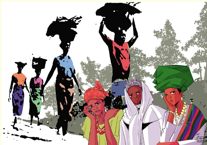
„Rest of the Weary“: Bild zum Weltgebetstag 2026 aus Nigeria von der Künstlerin Gift Amarachi Ottah