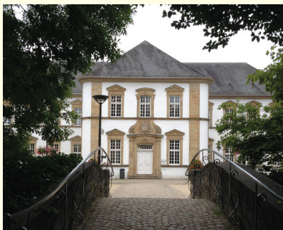
Führung Zentralbibliothek

Im Anschluss sind alle eingeladen, bei einer offenen Gesprächsrunde ihre Wünsche, Ideen oder Feedback direkt an die Bibliothek weiterzugeben – oder einfach ganz locker ins Gespräch zu kommen und sich auszutauschen.