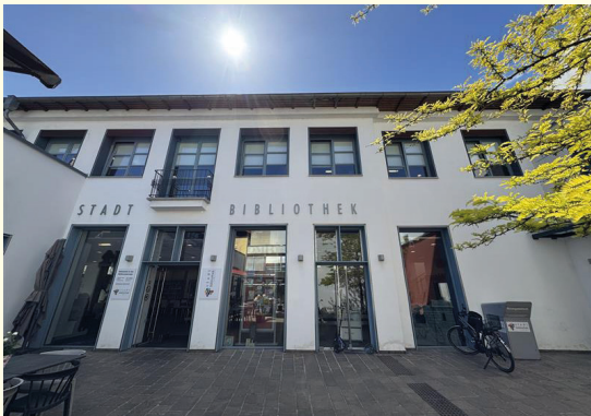
Führung Rathauspassage

Kontakt bei Fragen: stadtbibliothek@paderborn.de