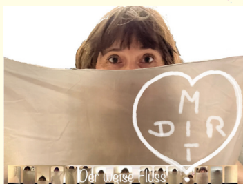
Katj © Katj

„Was, welches Wort drückt für dich Verbindung aus?“ Das hat die Künstlerin aus Paderborn bekannte und unbekannte Menschen gefragt und diese Worte auf Stoffstücke schreiben lassen. Daraus entstanden ist ein langer wei(s)ser Fluss. Dieses audiovisuelle Objekt aus Stoff richtet den Fokus auf das, was uns alle verbindet und setzt das Motto des diesjährigen Weltfrauentages „Give and Gain“ künstlerisch um.