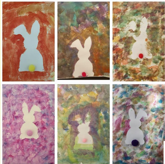
Aktuelle Bilder aus der Schule