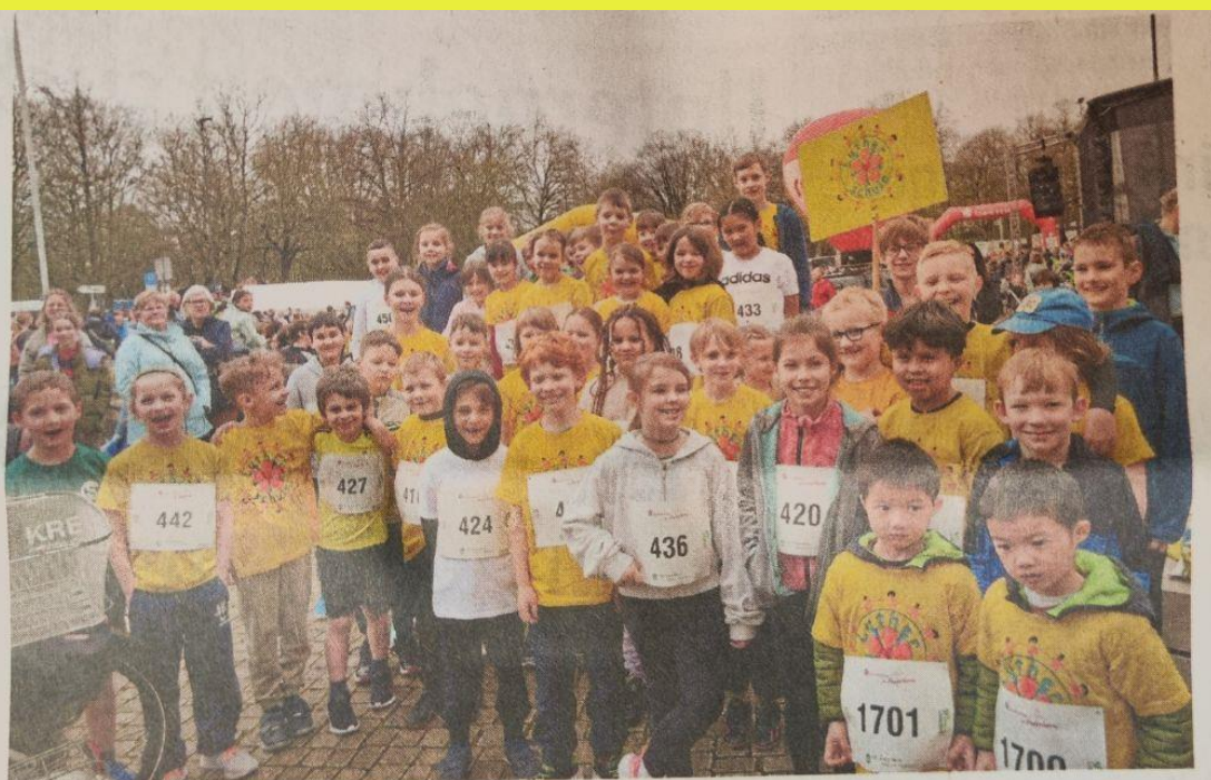
Die Kinder der Lutherschule können den Start kaum erwarten.