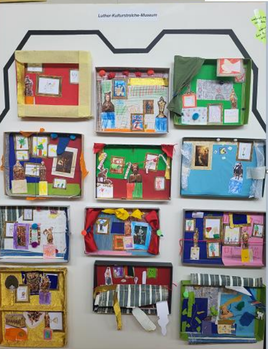
Das kleine „Ich bin Ich“ der 1a, Unterwasserwelten der 2c, Kulturstrolche Projekt der 2c