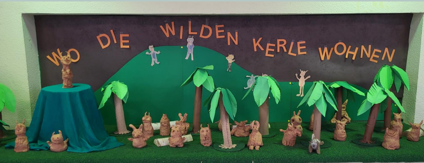
Schneeglöckchen der 1b, Schlittschuhläufer der 3b, Osterhasen der 2b, Wilde Kerle der 2a