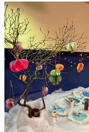
Pinguine aus Jahrgang 2, gestalteter Altar im Haupthaus