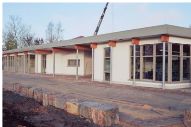
Errichtung der OGS 2005