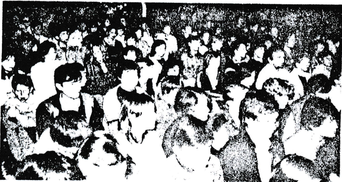
Un public de jeunes rassemblé à la salle du palais de justice, au Prieuré.

orchestre de Beethoven. Et c'est sur une Valse de l'empereur d'après Johann Strauss qu'ils devaient terminer magistralement ce concert.