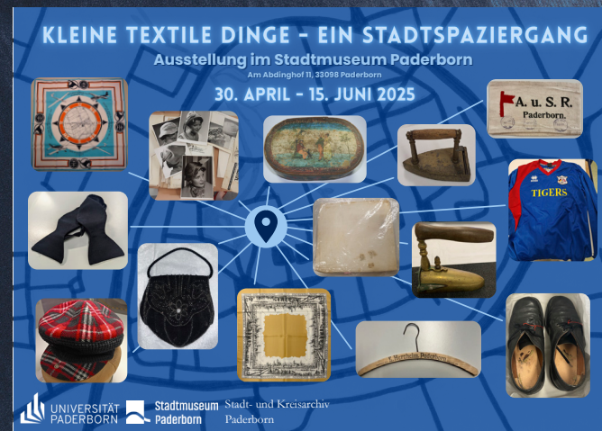
Plakat zur Ausstellung