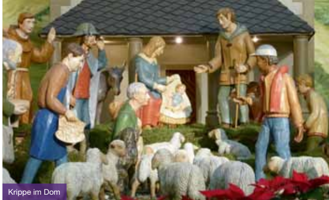
Krippe im Dom