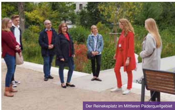
Der Reinekeplatz im Mittleren Paderquellgebiet