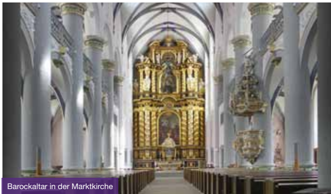
Barockaltar in der Marktkirche

Namhafte Autorinnen und Autoren haben vom Mittelalter bis in die heutige Zeit in Paderborn gelebt oder zumindest der Stadt einen intensiven Besuch abgestattet und Interessantes, Kritisches, Nachdenkliches und Belustigendes über die