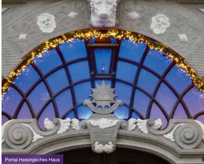
Portal Heising'sches Haus

Sa., 30.10., 14 Uhr Ostfriedhof Haupt- eingang/Parkplatz