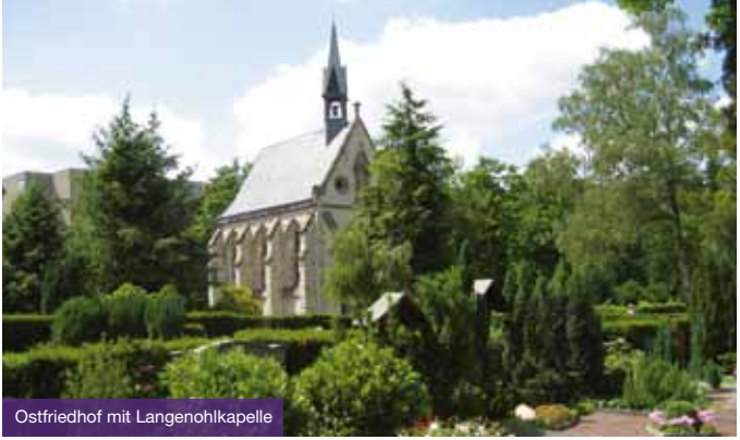
Ostfriedhof mit Langenohlkapelle

Orten wie dem ehemaligen Jesuitenkolleg, dem Rathaus oder Privathäusern bis in die heutige Zeit erhalten oder sind sogar neu entstanden. Während der Führung werden die lateinischen Inschriften aufgesucht, übersetzt und erklärt. Lateinkenntnisse sind nicht erforderlich!