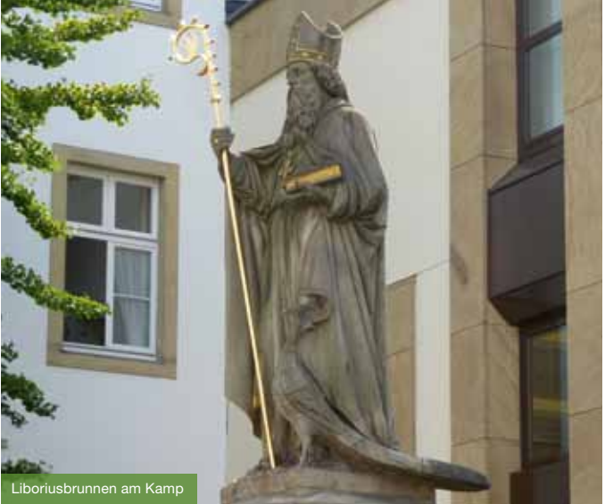
Liboriusbrunnen am Kamp