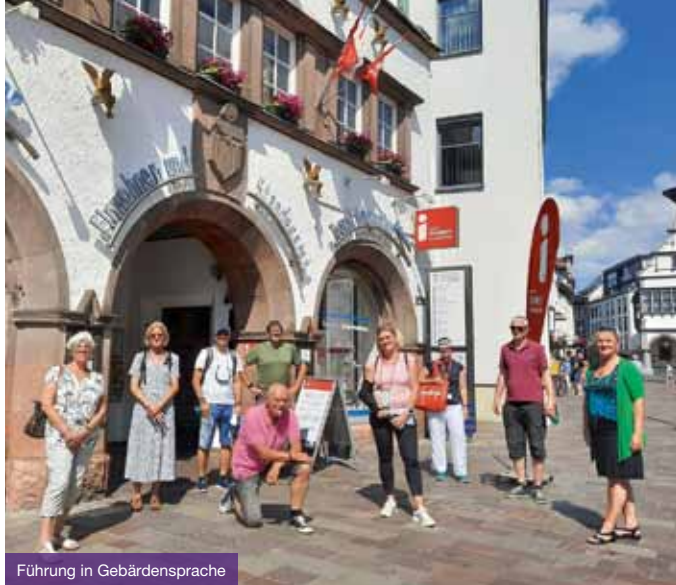
Führung in Gebärdensprache

Menschen ausgerichtet. Tasten, Hören und Fühlen stehen dabei im Vordergrund. So können beispielsweise die plastischen Stilelemente der Weserrenaissance am Beispiel des Rathauses erfühlt oder die Sehenswürdigkeiten und die ehemalige Stadtmauer anhand eines Bronzemodells ertastet werden.