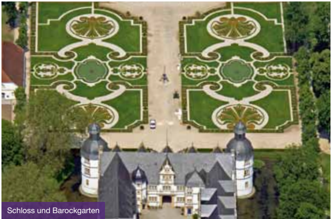
Schloss und Barockgarten

Schloß Neuhaus, die ehemalige Residenz der Paderborner Fürstbischöfe im gleichnamigen Stadtteil, zählt zu den bedeutenden Wasserschlössern Westfalens. Das restaurierte Schloss bietet mit seinen Nebengebäuden und dem rekonstruierten Barockgarten einen Anblick, bei dem man sich um Jahrhunderte zurückversetzt fühlt.