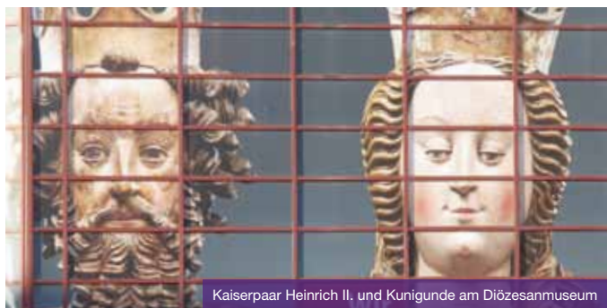
Kaiserpaa Heinrich II. und Kunigunde am Diözesanmuseum

Dieser Rundgang führt Sie zu Stationen, wo berühmte Frauen in Paderborn lebten