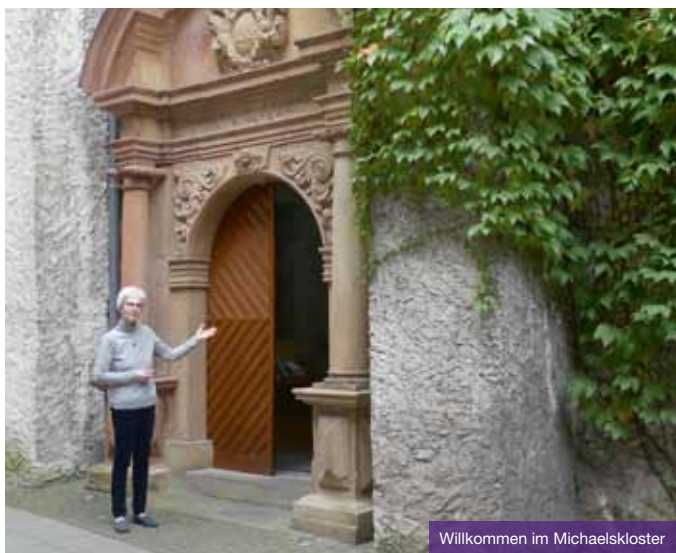
Willkommen im Michaelskloster