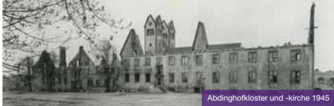
Abdinghofkloster und -kirche 1945

denkliches und Belustigendes über die Stadt geschrieben. Folgen Sie bei diesem episodenhaften Rundgang durch die Innenstadt den literarischen Spuren.