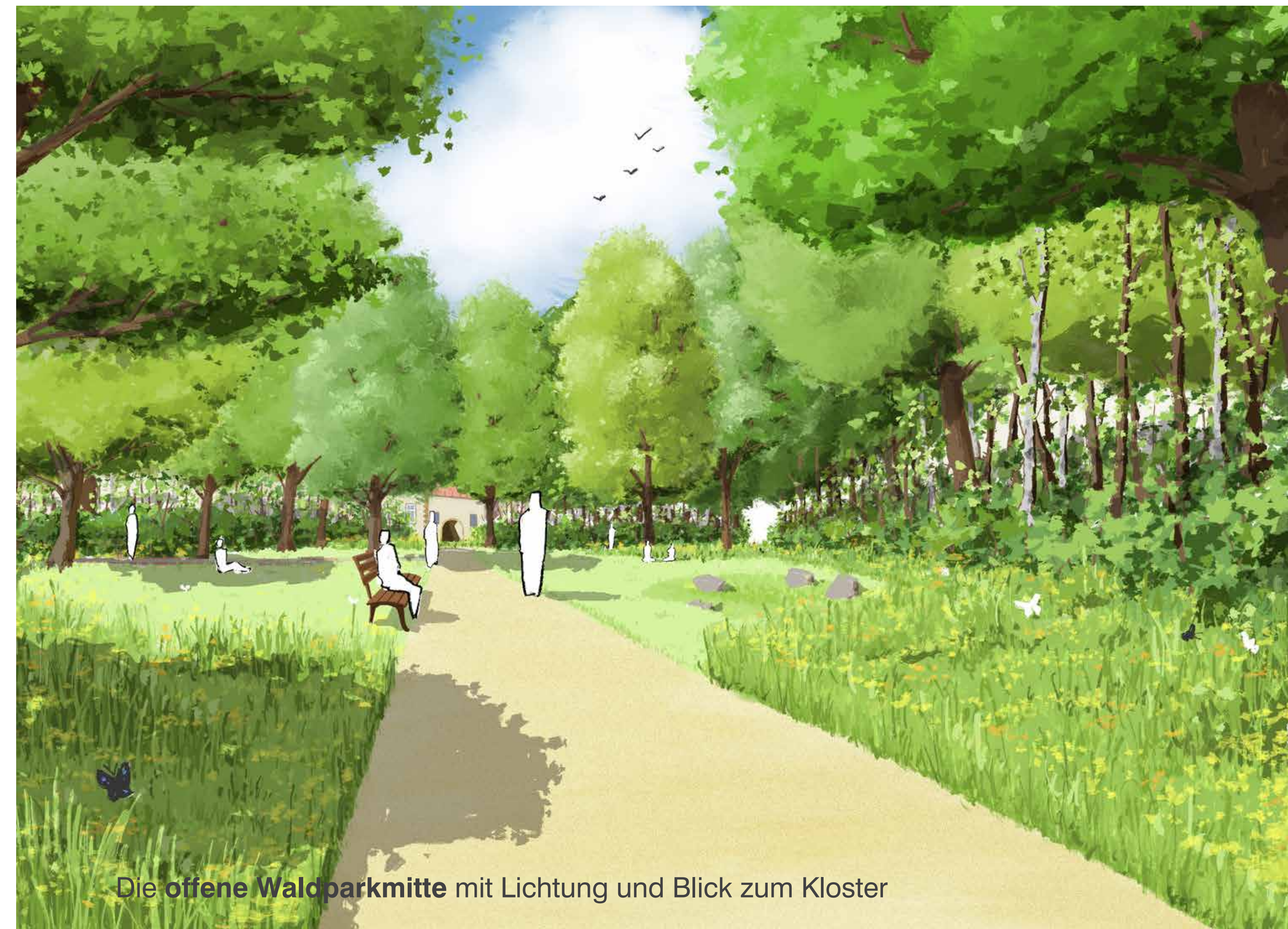
Die offene Waldparkmitte mit Lichtung und Blick zum Kloster