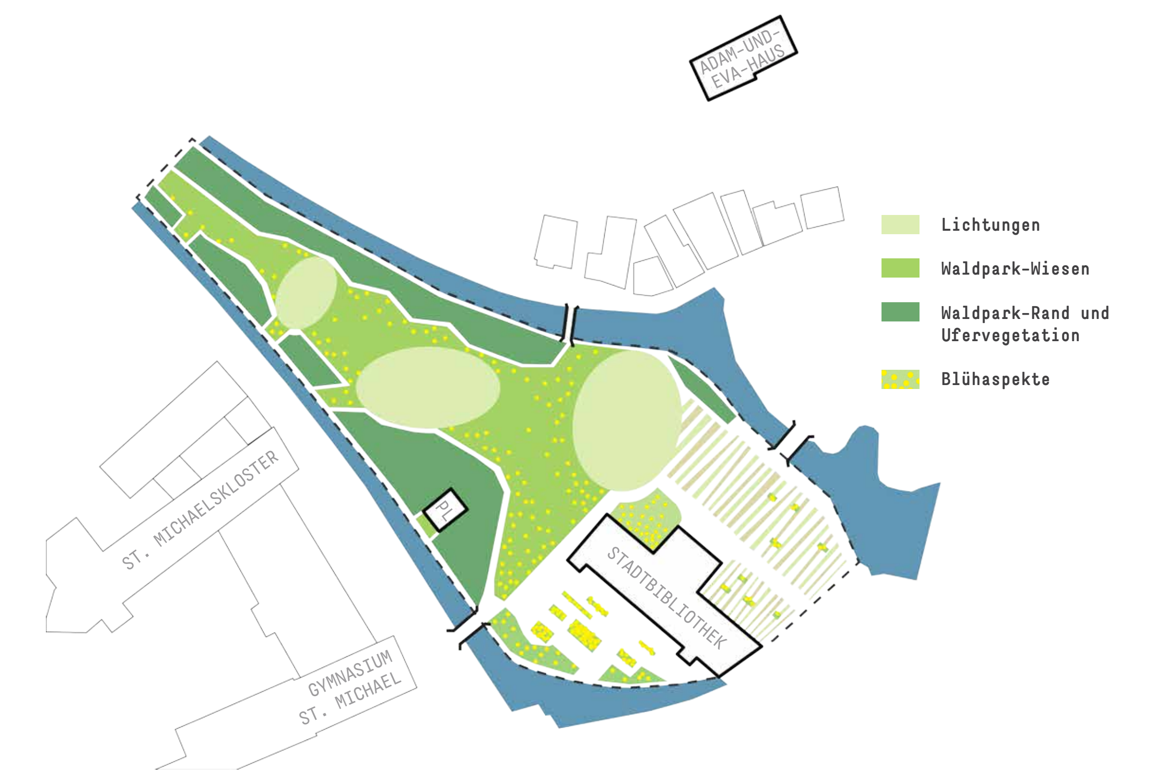
Stadtnatur mit vielfältigen Lebensräumen für Flora, Fauna, Mensch