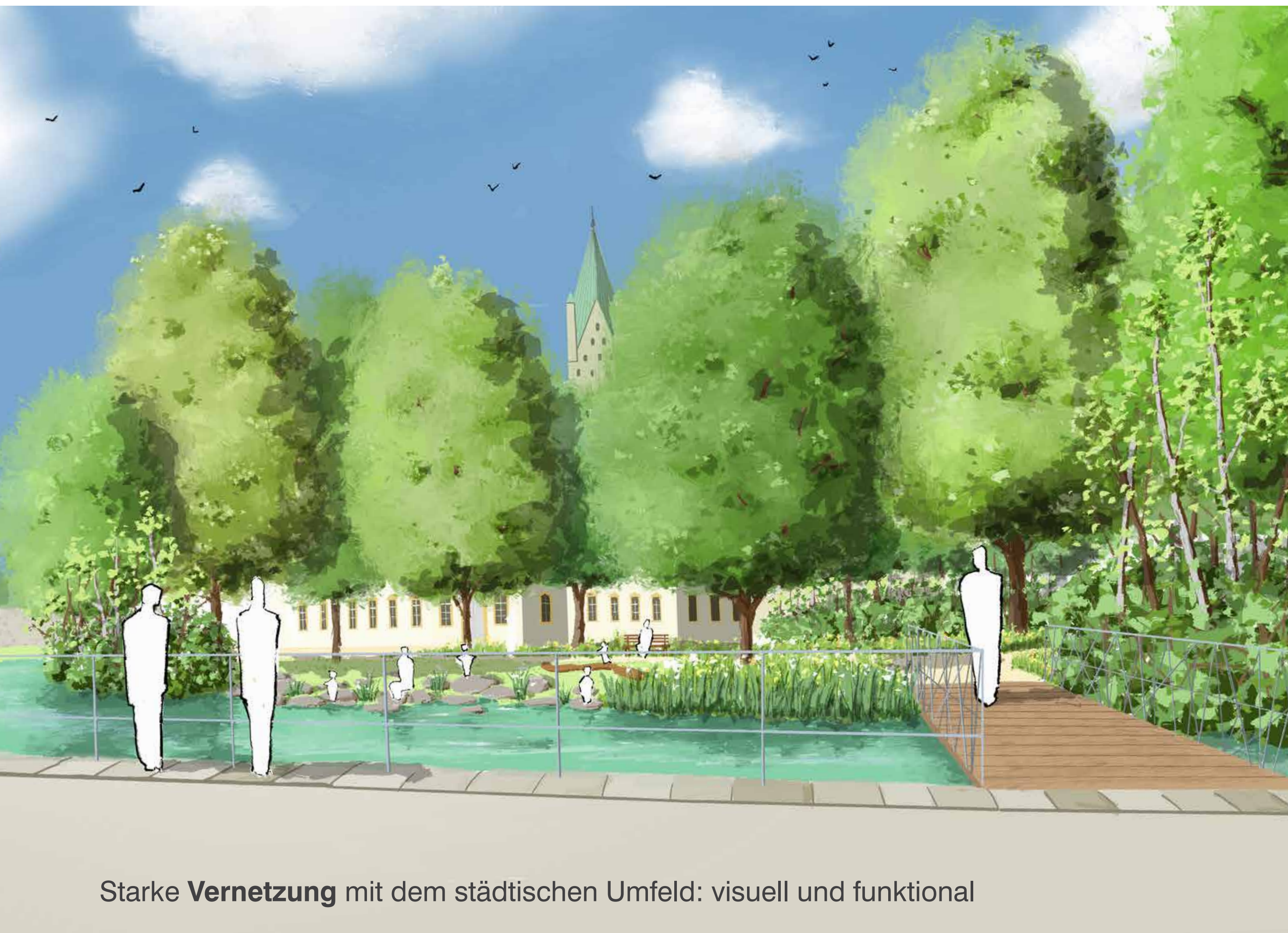
Starke Vernetzung mit dem städtischen Umfeld: visuell und funktional